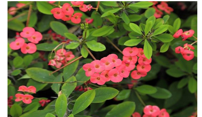
写真：ハナキリン 花言葉：自立