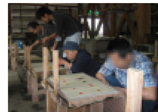
レク外出 紙すき体験

クラブ活動やレクリエーション外出を実施する事により余暇の充実を図っています。クラブ活動では、週1回の音楽クラブを中心に活動を展開しています。基本的に希望者のみの参加となっておりますが、外部講師と相談し利用者全員が楽しめるように努めています。また、外出では利用者全員を対象とした日帰り旅行等を実施し余暇を楽しむだけでなく、日常とは異なる環境の中で参加者の新しい発見につながるよう心がけています。