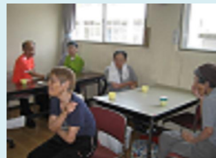
レクリエーション活動