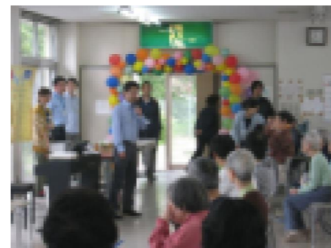
秋のレクリエーション